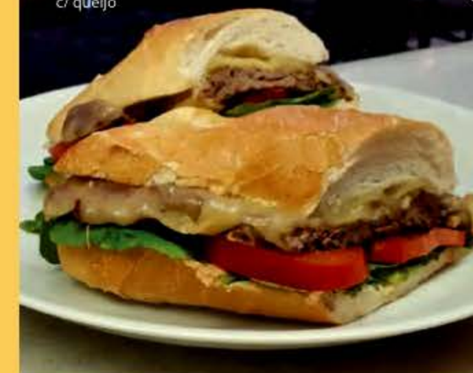
Filé-mignon ou filé de frango c/ queijo