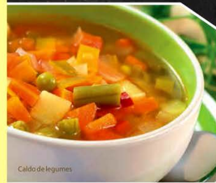
Caldo de legumes