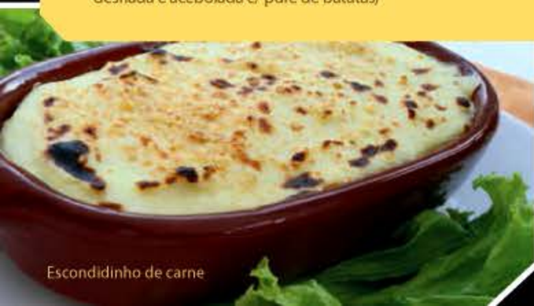
Escondidinho de carne