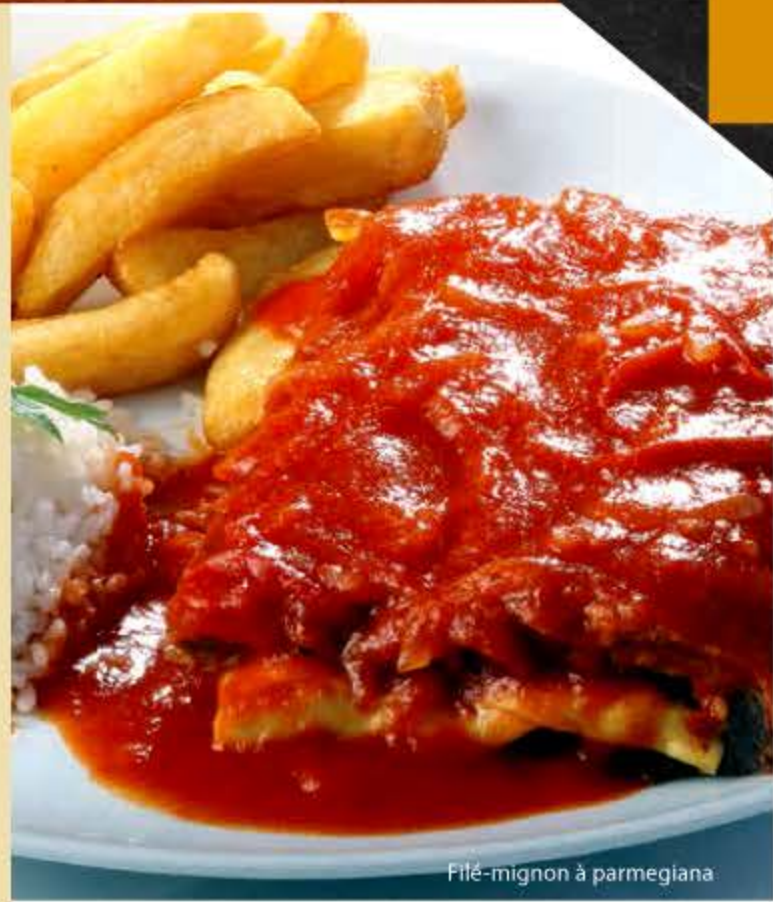
Filé-mignon à parmegiana